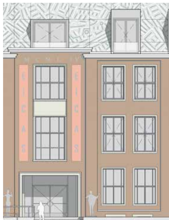
Entree Nieuwe Markt 23, Museum EICAS

over de glaspanelen. Het origineel, dat deel uitmaakt van een serie met onder meer Amsterdam, Stockholm, Los Angeles en Madrid is nu al aan de Polstraat te bewonderen. Van elke stad pakte de kunstenaar de essentie en versimpelde die tot een 'code': het City DNA. Zo laat hij je de stad herontdekken; zoekend naar herkenning in een wirwar van streepjes en cirkels, die de wezenlijke delen van de stad vertegenwoordigen. Als je goed kijkt herken je de Lebuïnus, de IJssel en de Wilhelminabrug. En daarna vast nog veel meer.