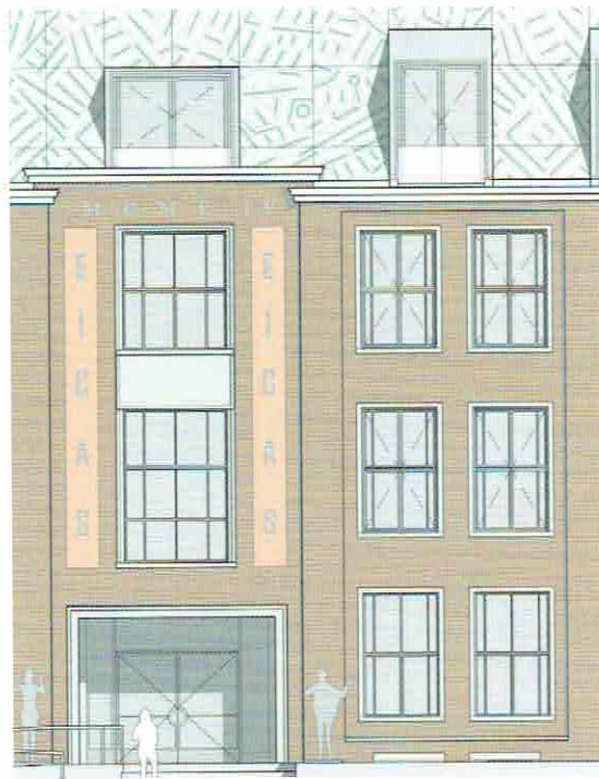
Entree Nieuwe Markt 23, Museum EICAS

over de glaspanelen. Het origineel, dat deel uitmaakt van een serie met onder meer Amsterdam, Stockholm, Los Angeles en Madrid is nu al aan de Polstraat te bewonderen. Van elke stad pakte de kunstenaar de essentie en versimpelde die tot een 'code': het City DNA. Zo laat hij je de stad herontdekken; zoekend naar herkenning in een wirwar van streepjes en cirkels, die de wezenlijke delen van de stad vertegenwoordigen. Als je goed kijkt herken je de Lebuïnus, de IJssel en de Wilhelminabrug. En daarna vast nog veel meer.