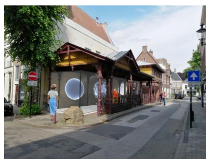
Pitch Stadscafé Architectuurcentrum Rondeel: Botermarkt als openbare Kunstetalage