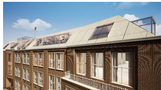
Ontwerp glazen dak 'City DNA - Deventer' (Lu Xinjian)