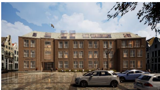
Artist Impression EICAS-museum (Hans van Heeswijk architecten)

Begin 2020 zal tot de selectie van een aannemer worden overgegaan.