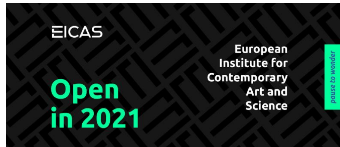
Nieuwe huisstijl (Mediavisie)